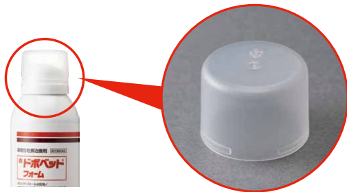
ポリプロピレン (ランダム共重合体)